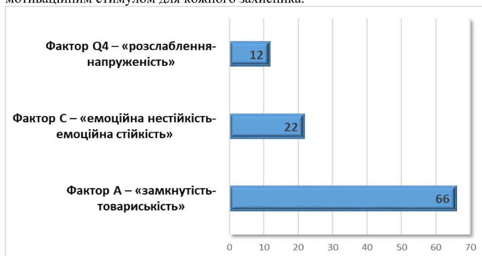
Рис. 1. Вираження факторів за методикою Р. Кеттелла (у %)

Фактор Q4 – «розслаблення–напруженість». 12 % опитаних отримали високу оцінку, яка свідчить про напруженість, фрустрованість, наявність збудження і неспокою. Стан фрустрації, в якому перебуває людина, є наслідком підвищеної мотивації, їй властиве активне незадоволення станом речей. Маючи обов'язок захищати нашу державу, даючи присягу, військовий усвідомлює свою відповідальність за належне несення служби, це є головним мотиваційним стимулом для кожного захисника.