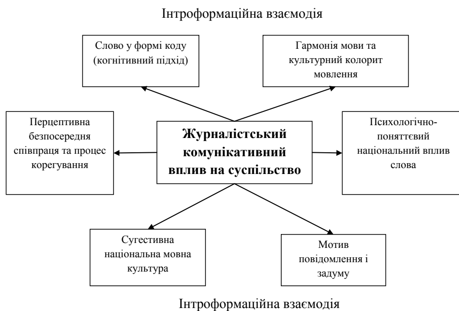
Рис. 1. Комунікативна модель впливу журналіста на суспільство