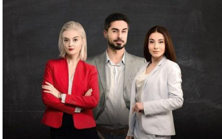
Рис. 3. Персонажі-дорослі: зліва направо – пані завуч школи, учитель англійської, учителька економіки й мама Нікі (Серіал «Школа»)