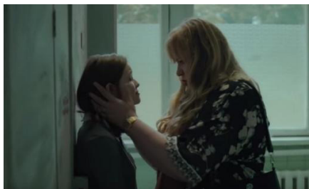
Рис. 1. Поліна та її мама (Серіал «Перші ластівки»)

стрічки констатує, що уважно вивчала потреби глядацької аудиторії певного віку 17 . Ярослав Підгора-Гвяздовський вважає, що «текстуально серіал можна вважати першим у своєму роді україномовним продуктом (виробництво компанії «1+1 Digital Studios»). Із першого погляду відзначається адекватність почутого в кадрі з вітчизняними реаліями, в даному випадку з реаліями сучасної української школи» 18 . Таким чином, серіал відображає певні проблемні поля, актуальні для старших підлітків, одинадцятикласників: відносини; вимоги дорослого світу, що викликають спротив та конфронтацію з батьками; бажання визнання й реалізації; одночасно розгубленість і агресію. Образи батьків у серіалі не є головними, це скоріше тло, на якому оприявнюються страждання підлітків, однак образи цього проблемного «тла» досить цікаві для психологічного та соціального аналізу.