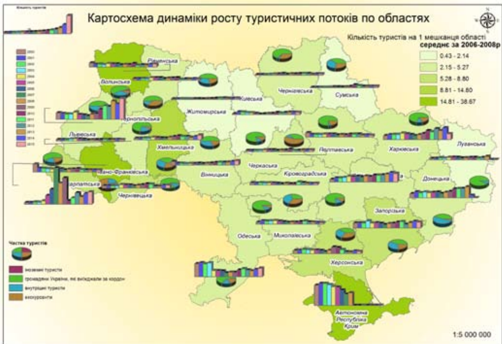
Рис. 1. Картограмма динаміки туристичних потоків Україною 2000–2015 рр. (розроблено автором на основі державної статистики України)

обл. відвідало 5 750 осіб, а Львівську – 16 162 особи. За чисельністю туристів, як бачимо зі стовпчикових діаграм, лідирують Львівська та Одеська області; дещо поступаються лідерам Івано-Франківська, Дніпропетровська області. Піковим для більшості областей був 2003 р. (АР Крим, Одеська, Запорізька, Закарпатська, Волинська, Львівська області), після чого відбувся деякий спад чисельності туристів. Останніми роками помітний найбільший спад. Це, на наш погляд, можна пояснити фінансово-економічною кризою, а також подіями, пов'язаними з анексією Автономної Республіки Крим та проведенням антитерористичної операції на території Донецької та Луганської областей. Усе це негативно вплинуло на в'їзний туристичний потік, структуру туризму та туристичні можливості країни як на внутрішньому, так і на зовнішньому туристичних ринках.