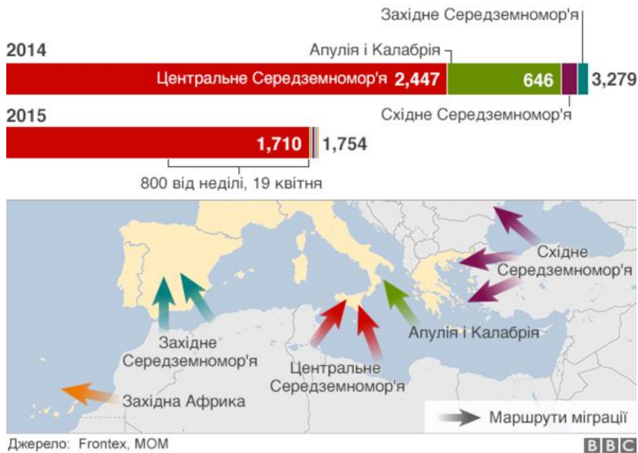
Рис. 3. Загибелі мігрантів у Середземному морі за маршрутами.

Європейський комісар з міграції та внутрішніх справ Дімітріс Аврамопулос сказав: «Комісія показала, що може діяти швидко і рішуче, щоб краще керувати міграційними потоками, разом із зміцненням Плану дій по боротьбі з контрабандистами, відповідати на найбільш актуальні проблеми, з якими ми стикаємося».