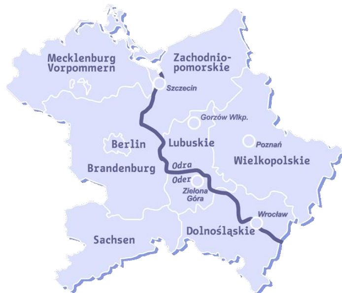
Рисунок 2. Карта мережі Одерське партнерство (мовою оригіналу)

На місцевому рівні німецькі та польські міста, які історично опинились розділеними кордоном, об'єдналися за допомогою транскордонних проектів, і деякі з них підкреслюють спільну транскордонну ідентичність (проекти «Франкфурт-на-Одері – Слубіце: без кордонів», «Євромісто Губен-Губін» і «Євромісто Герлиц-Згожелєць»).