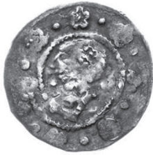
Ryc. 8. Kwartnik z głową Maura i czeskim Lwem (po obu stronach ślady podwójnego bicia), 1,68 g, 19 mm.