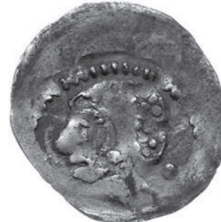
Ryc. 9. Parvus z głową Maura i czeskim Lwem, 0,292 g, 12,03-13,66 mm.