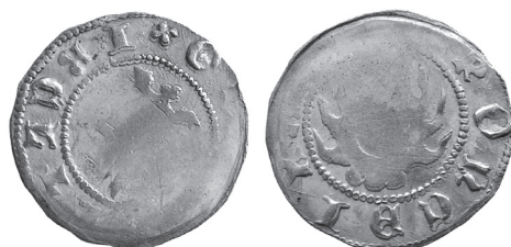
Ryc. 6. Kwartnik typu Friedensburg 459/246 z napisami na obu stronach, brak danych pomiarowych.