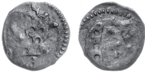
Ryc. 7. Parvus z torsem orła w koronie i literą G, 0,19 g, 9,9 mm.

pomagają więc w atrybucji kwartnika i, tym bardziej, denara z Dzwonowa. Jedyne jelenie poroże może być wskazówką o pochodzeniu tych monet. Jak zauważył Zbigniew Bartkowiak, często mamy na kwartnikach do czynienia z zestawieniem znaku książęcego ze znakiem wyższego urzędnika książęcego 26 . W takim razie zapytajmy, czy właściciela znaku „jeleni wieniec” znajdziemy na dworze Henryka I (III) głogowskiego, czy w polskim otoczeniu Waclawa II 27 ? Niestety, takiego znaku przedstawionego wprost nie widzimy w zachowanych źródłach. Można wprawdzie wskazać w obu grupach przedstawicieli możnowładczego rodu Jeleni pieczętujących się całym jeleniem 28 , a w dodatku sam Dobrogost ze Zwanowa też używał takiego godła, choć wywodził się z rodu Nałęczów. Monet z jeleniem z tej epoki – kwartników i parvusów – mamy jednak całkiem sporo i widzimy, że nie było potrzeby upraszczania tego godła do samego tylko wieńca. Ten ostatni znak nie był pars pro toto jelenia, bo nie przedstawia żywego jelenia, a trofeum myśliwskie. Należał zatem do kogoś z licznej grupy urzędników książęcych, których emblematy nie zostały objaśnione w znanych nam źródłach i trop podsunęty przez kwartniki nie zaprowadził nas do rozwiązania. Uświadomił jednak, że denar z Dzwonowa może należeć do grupy tzw. parvusów – drobnych monet towarzyszących emisji kwartników tak na (Dolnym) Śląsku, jak w Wielkopolsce. Parvusy bowiem często powtarzały jedną lub obie strony kwartników, zwykle tylko pozbawiwszy je otoków.