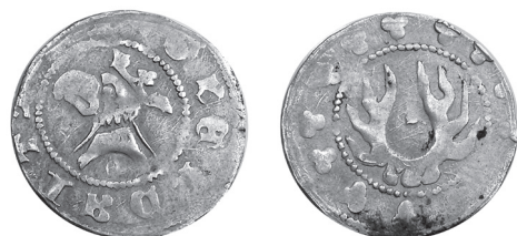
Ryc. 5. Kwartnik typu Friedensburg 459/246 z napisem na awersie, brak danych pomiarowych.