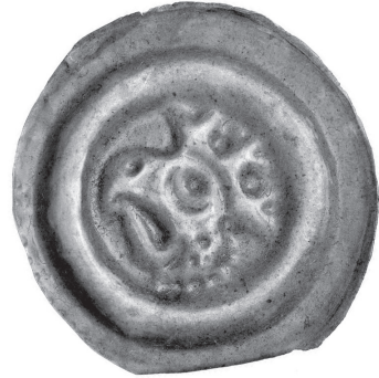
Ryc. 2. Szeroki brakteat śląski z głową orła w koronie.

Motyw głowy orła w koronie na ikonicznym rewersie jest niezbyt wyraźny i nie zezwala na analizę stylu i detali wizerunku. W każdym jednak razie – przeciwnie niż awers – uznać go trzeba za typowy motyw brakteatów polskich z przełomu XIII/XIV wieku. Wcześniej pojawił się w Polsce na kilku anonimowych szerokich brakteatach śląskich 10 , w tym jednym szczególnie wyrazistym, znanym ze skarbów z okolicy Gręboszowa i okolicy Strzelina 11 (Ryc. 2). Ten drugi skarb, wcześniejszy, mógł trafić do ziemi w 1. połowie lat osiemdziesiątych XIII wieku 12 . Na tej podstawie można przypuszczać, że szeroki brakteat z głową orła w koronie jest monetą księcia wrocławskiego Henryka IV Probusa (orzeł w koronie widnieje na jego nagrobku), choć wydaje się, że monety dużego i silnego Księstwa Wrocławskiego powinny być liczniejsze. Brakteaty z torse lub głową orła w koronie nie wystąpiły w klasycznych polskich skarbach z końca XIII wieku, z Radzanowa, Sarbska i Wielenia, ale widzimy je w skarbach nieco późniejszych: z Lubomi (po ok. 1305) 13 , Lichyni I (po 1311), Lichyni II (po 1311) 14 , Wielkiej Wsi