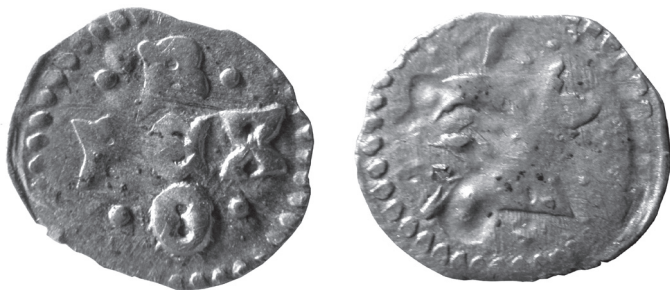
Ryc. 1. Denar z Dzwonowa, średnica 10,8 mm.

wyraźnie, przedstawia złożoną z pięciu liter inskrypcję: • B • / RCX / • O •. Litery mają formy typowe dla majuskuły gotyckiej z końca XIII i początku XIV wieku. B , R , X i O należą do nieco wysmuklonej kapitały o miękkim dukcie, podczas gdy okrągłe, zamknięte C pochodzi z uncjały. Jedyne lekkie zaostrenie w połowie brzuszka tej ostatniej litery uważane jest za cechę nieco późniejszą, widoczną w polskich inskrypcjach dopiero w połowie XIV wieku 8 . Podobne w stylu liternictwo znajdujemy na monetach węgierskich Stefana V (1270–1272), Władysława IV (1272–1290) i Andrzeja III (1290–1301), odleglejsze analogie można znaleźć na groszach i dukatach weneckich Franciszka Dandolo (1329–1339). Nie widać natomiast podobieństwa do monet czeskich z początku XIV wieku, gdzie liternictwo wykazuje silne wpływy florenckie. Obie strony monety otoczone są perełkową obwódką wykonaną jedną, prostą puncą. Krążek monety jest wyraźnie owalny i ma ślady rozklepywania z podłużnego wieloboku.