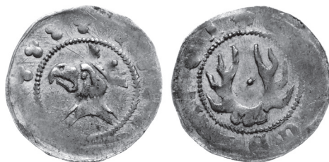
Ryc. 4. Kwartnik typu Friedensburg 459/246 z napisem na rewersie, 1,75 g, 20 mm. Warszawskie Centrum Numizmatyczne, oferta nr 140 076