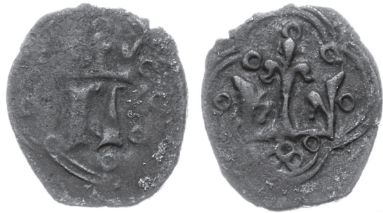
Рис. 9. Денарій Владислава Опольського з приватної колекції із зображенням прямокутної корони.

Карбування денаріїв з прямокутними коронами (Рис. 8) у 1371–1372 рр. підтверджується наявністю перших типів денаріїв Владислава Опольського, де поєднується ініціал князя на аверсі та прямокутна корона на реверсі (Рис. 9). Зафіксовано таку ж прямокутну корону на декількох стандартних денаріях Людовика Угорського (вони виставлялися на аукціоні WCN у 2016–2018 рр. і їхня вага складала всього 0,87 г, 0,89 г, 0,75 г, що вказує на їх випуск у перші роки правління Людовика – орієнтовно 1379–1380 рр. – Рис. 10). Важчих денаріїв Людовика з прямокутною короною не зафіксовано.