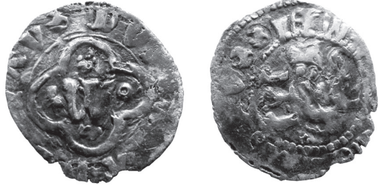
Рис 1. Грошик Владислава Опольського з приватної колекції з легендою реверсу “MONETARUSSIEW”.

дивною легендою до Л. М. Д. (якби всі три монети мали б ознаки однієї руки, то могло б здатися, що їх підробляли підпільно, а не виготовляли на Л. М. Д.).