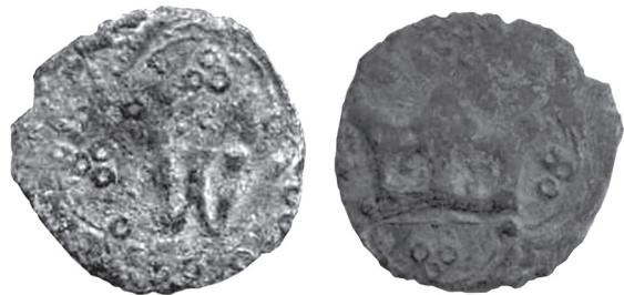
Рис. 10. Денарій Людовика Угорського з приватної колекції із зображенням прямокутної корони.

Тобто, у період першого “безкоролів’я” в 1371–1372 рр. випускали монети з коронами на обох боках, деякі з них мали на реверсі прямокутну корону. На те, що штемпель з прямокутною короною не виготовляли за життя Казимира III, а тільки після його смерті, вказує відсутність денаріїв з ініціалом “К” і подібною короною. Виглядає, що їх спеціально виготовили для випуску “безіменних” монет. Після приїзду Владислава Опольського до Львова збережені штемпелі реверсу з прямокутною короною використали для карбування його стандартних денаріїв, а також перших типів монет Людовика Угорського.