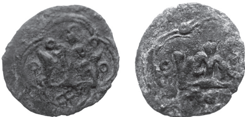
Рис. 8. Денарій з колекції Ю. Котика із зображенням корони на обох сторонах монети, одна з яких є прямокутною.

Крім того, на денаріях з 1371–1372 рр. зустрічаються прямокутні корони., але не відомо жодного варіанту денаріїв з коронами на обидвох сторонах, де поєднувалися б прямокутна корона і корона з вивернутими краями. Очевидно ці два варіанти двокоронових денаріїв випускали у різні роки.