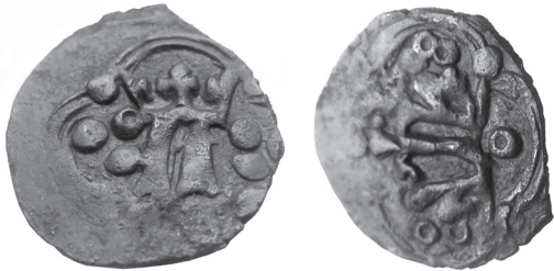
Рис. 7. Денарій Людовика Угорського з колекції І. Федая із зображенням корони з вивернутими краями.

Ці монети не можна віднести до згаданих раніше двокоронових денаріїв, карбованих у Львові в 1371–1372 рр., адже на денаріях з ініціалом Казимира III не зафіксовано жодного випадку застосування корон із вивернутими краями. Натомість, такі корони бачимо і на деяких денаріях з ініціалом Людовика (Рис. 7).