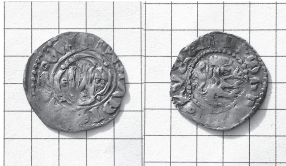
Рис 2. Грошик Владислава Опольського з приватної колекції з левом направо.

За останні роки знайдено теж рідкісні монети з реверсом, на якому лев повернутий направо. Одна із них – це Грошик Владислава Опольського, про який вперше згадав колекціонер К. Стецький ( Wiadomości Numizmatyczne , W–wa. 1996 r., Nr 4, str. 237). При складанні першої версії каталогу автор у жодній з вивчених музейних і приватних колекцій такого різновиду грошика не виявив ( Рис. 2 ).