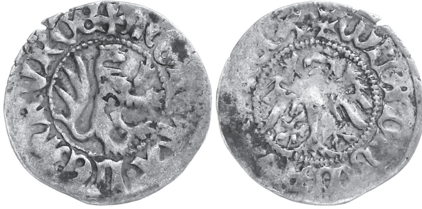
Рис 3. Півгріш Владислава Опольського з приватної колекції з левом направо.

Саме при вивченні цієї монети польському досліднику Вітольду Боровському вдалося встановити, що штемпель її реверсу виготовив майстер, який до 1407 р. виготовляв коронні півгроші у Кракові. Його монети мали свої характерні риси не притаманні іншим краківським майстрам. Ці ж аналогічні риси В. Боровському вдалося знайти на трьох львівських півгрошах. Всього три монети і всі гібриди – дві у поєднанні з штемпелями майстра VI і одна у поєднанні з штемпелем майстра VII. Жодної монети, де штемпелі обох сторін виготовив би новий майстер, названий нами майстром VIII, поки що не виявлено, що може вказувати на короткочасність його перебування у Львові.