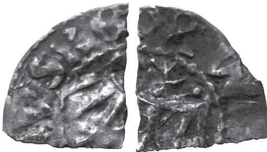
Рис. 11. Два фрагменти розламаного грошика Владислава Ягайла з приватної колекції.

На цікаві роздуми щодо важливості обігу на галицьких ринках мідної місцевої монети наштовхує скарб, знайдений у м. Белзі – колишній столиці одного з удільних волинських князівств. Знахідка складалася всього з двох невеликих частинок розламаного галицько-руського грошика Владислава Ягайла (Рис. 11). Тип грошика 7 “в”, карбований приблизно у 1394–1398 рр. 12