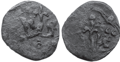
Рис 6. Денарій з колекції О. Базара із зображенням корони на обох сторонах монети, одна з яких має вивернуті краї.

Появилася й інша група мідних монет, яка вимагає детального вивчення. Це денарії, на обох сторонах яких зображено корону, але одна з цих корон має бокові краї, вивернуті назовні (Рис 6). Середня вага 4 шт. таких денаріїв із колекції О. Базара складає 1,14 г.