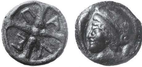
Fig. 3. Olbijski “as” z legendą ΠΑΥΣ. Zbiory Muzeum Narodowego w Warszawie (Moneta Olbii średnica 63 mm)

rzyć warunki techniczne do produkcji monet odlewanych na miejscu. Istotne wydaje się również ułatwienie handlu w regionie. Te same monety obecne były na rynkach każdej z poleis 45 . Odrębnej oceny wymaga kwestia, czy oparcie obiegu monetarnego w Nikonion , na monetach Histrii i Olbii przynosiło szczególne zyski obu społecznościom emitującym własne monety.