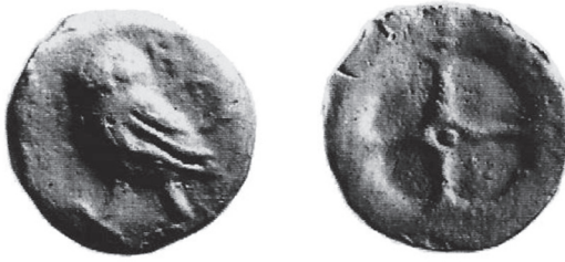
Fig. 1. Moneta z legendą ΣΚΥ znaleziona w Nikonion. Muzeum Archeologiczne w Odessie (Moneta Skylesa średnica 31 mm)

szych rozważań, na emisję tę składają się monety trzech nominalów 18 . Ikonografia tych monet – na jednej stronie wyobrażenie stojącej sowy i legendą ΣΚΥΛΗ (na egzemplarzach największych), ΣΚΥ (Fig. 1), ΣΚ a na drugiej koło o czterech szprychach – nawiązuje do idei olbijskich “asów”. Olbijskie “asy” znalezione zostały w Nikonion.