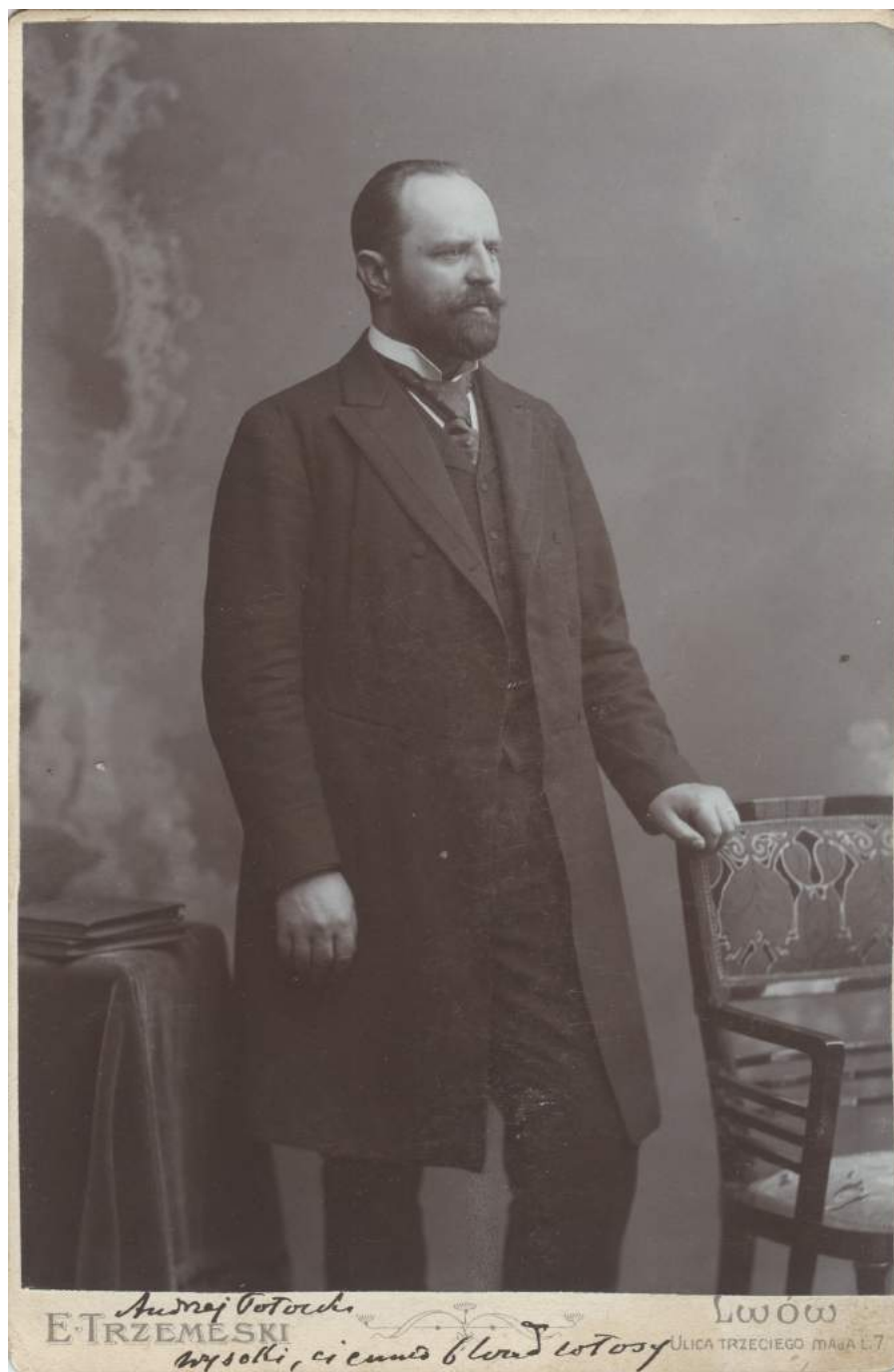
Фото Анджея Потоцького початку XX ст. (з колекції Відділення “Палац мистецтв імені Тетяни і Омеляна Антоновичів” Львівської національної наукової бібліотеки імені Василя Стефаника)