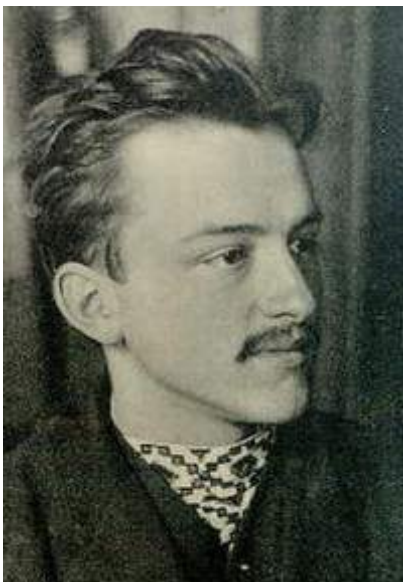
Фото Мирослава Січинського з часу ув'язнення

дій, однак безумовно були в них і складники особистого характеру. Так, певну схильність до нервових розладів демонстрували деякі родичі М. Січинського по лінії матері, декілька з них покінчили життя самогубством. У 1907 р. добровільно пішов із життя брат М. Січинського Мстислав. Мирослав Січинський твердив, що той факт не справив на нього великого враження, бо вони з братом нібито не були дуже близькими, однак навряд чи він міг минути як цілком малозначущий епізод.