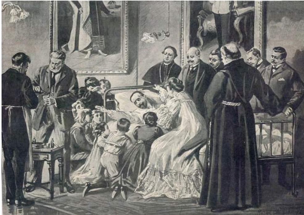
Зображення помираючого Анджея Потоцького у краківській газеті "Nowości Illustrowane" 25 квітня 1908 р.

Скжинський і Стефан Ішковський, дещо згодом прибїгли лікарі та вищі урядники.