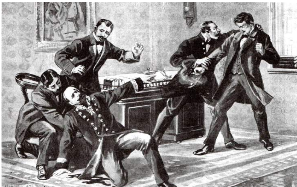
Вбивство Анджея Потоцького Мирославом Січинським, рисунок невідомого художника 1908 р.

(з книги: Історія Львова. У трьох томах /