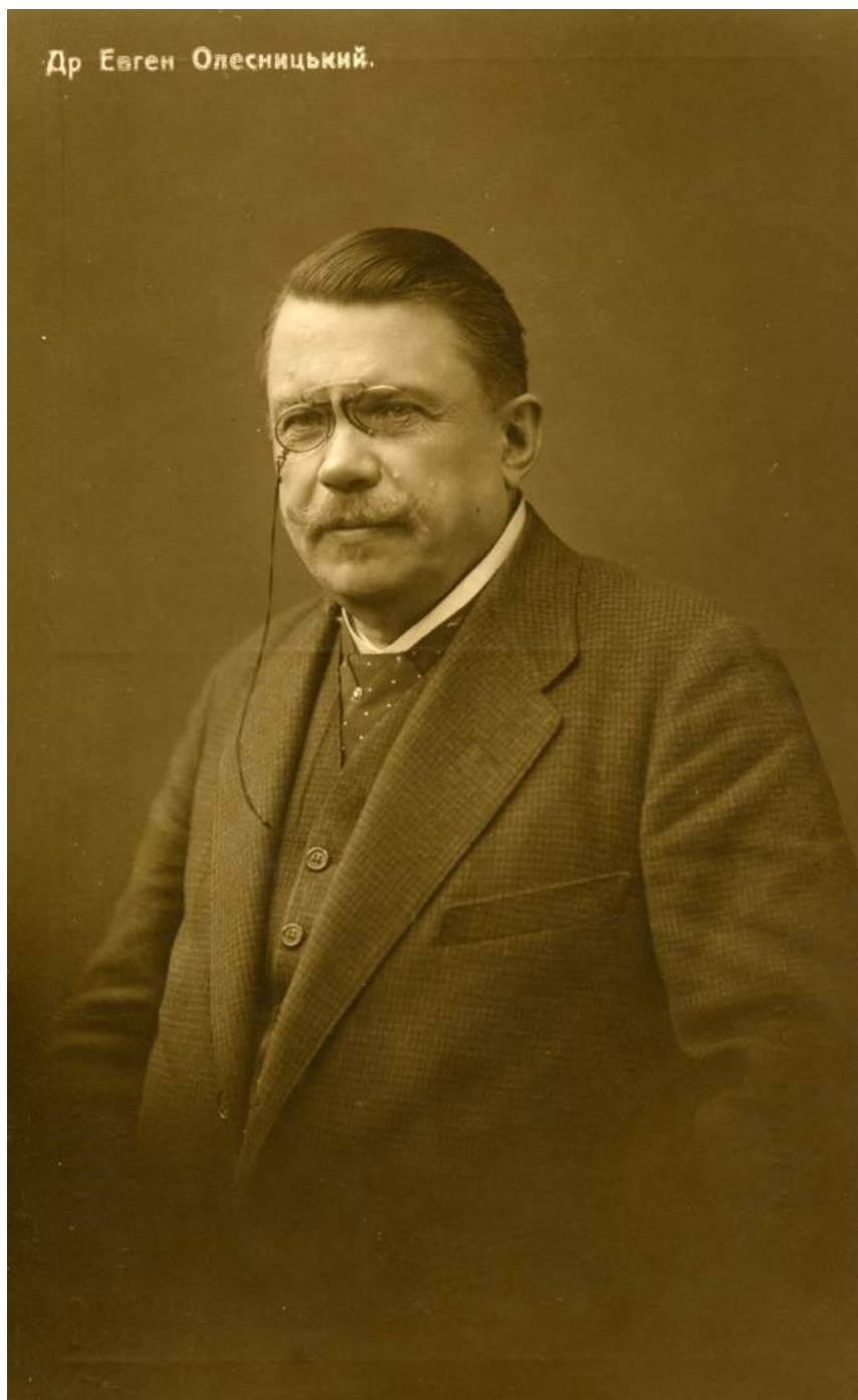
Фото Євгена Олесницького 1916 р. (з колекції Юрія Завербного, м. Львів)