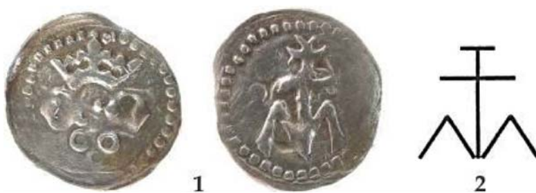
Рис. 6. 1 – монета (денарій, обол?) подільського князя Федора Коріатовича (1388–1394); 6. 2 – зображення штрихового знаку на печатці Федора Коріатовича з його грамоти від 1403 р.

Українські історики О. Однороженко 127 та С. Келембет 128 , а віднедавна й Н. Яковенко 129 , також відкидають версію Ю. Пузини. Для їх аргументації серйозним під'рунтям можуть послужити знахідки українських нумізматів Р. Саввова та О. Погорільця, яким вдалося віднайти подільські монети Коріатовичів. Вони ж звернули увагу на схожість гербових знаків князя Федора Коріатовича з князями Збарзькими (Рис. 6. 1, 6. 2.) 130 .