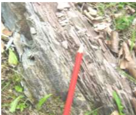
Рис. 2. Фрагмент строкатоколірного горизонту. Сушманецька світа. Монастирцький покрив. Лівий борт р. Мала Уголька, ліва притока р. Теремля.

Розріз сушманецької світи починається сірими пісковиками (100–150 м) без турбідитних текстур. На них залягає строкатоколірний горизонт (40–50 м), представлений вишнево-червоними, бурачково-червоними та сіро-зеленими аргілітами (рис. 2). Вони мають прошарки алевролітів, алевропсамітів, дрібнозернистих пісковиків з турбідитними текстурами Боума типу T_{bcde} , T_{cde} . Для аргілітів зафіксовані тонка горизонтальна або масивна шаруватість, що є ознакою геміпелагічної седиментації. Вік нижнього строкатого горизонту близький до межі палеоцену–еоцену [8, 9]. За нашими дослідженнями і працями попередників, на нижньому строкатоколірному горизонті розташована товща сіро-зеленого тонко- і різноритмічного перешарування пісковиків, алевролітів, аргілітів (200–300 м). Ці породи, за даними седиментологічного аналізу, є псамітовими турбідитами з текстурами типу T_{bcde} , T_{abcde} , T_{cde} . Турбідити перешаровані з карбонатними і некарбонатними пелітовими відкладами, які мають ознаки геміпелагітів і/або продуктів тонкозернистих дистальних турбідитних потоків. У верхній частині сушманецької світи простежується ще один строкатоколірний горизонт (10–20 м).