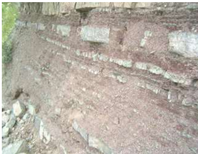
Рис. 1. Над'яменський строкатоколірний горизонт. Манявська світа. Скибова структурно-фаціальна зона. Потік Гребенець, права притока р. Опір.

польових і лабораторних досліджень розпізнавали літодинамічні типи порід. Для цього аналізували структурно-текстурні риси порід та виконували порівняльний аналіз їх із відомими модельними діагностичними ознаками. У лабораторних умовах породи вивчали методами петрографічної та мінералогічної діагностики. Мінералогічний склад порід діагностували за допомогою рентгенівського аналізу. Проаналізовано дифрактограми, на яких відображені характерні базальні відбиття мінералів. Мінеральний склад аргілітів визначали за програмою Match [20]. Хімічний склад порід з'ясували за методикою В. Авідона [1] і перераховували за методиками О. Предовського [15] та Я. Юдовича [17].