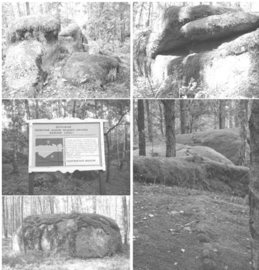
Рис. 2. Державний геологічний заказник “Кам’яне село”. Валуноподібні скелі північно-західної частини Коростенського плутону. Виходи кристалічних порід на поверхню.

автохтонного валуноутворення і внести значні корективи у геологічну історію розвитку регіону. Дослідження раніше не доступної території допоможе розширити знання про геологічні процеси, характер і вплив Суцано-Пержанської розломної зони на будову Волинського МБ.