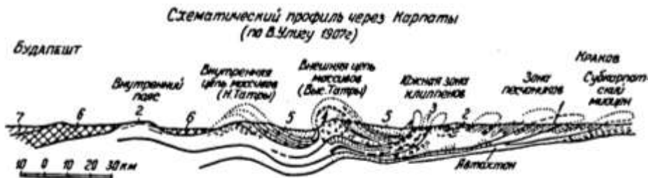
Рис. 2. Геологічний профільний розріз по лінії Будапешт–Краків:

1 – Суббескидський; 2 – Бескидський; 3 – Пенінський та Субпенінський покритви і південна зона кліпенів; 4 – Високотатранські покритви; 5 – Субтатранський покритв (В. Альпійський 1); 6 – покритв внутрішніх поясів (В. Альпійський 2–3); 7 – покритв угорських центральних масивів; 8 – Семиградський покритв; 9 – молоді вулканічні утворення; 10 – молоді третинні відклади Угорщини: Семиграддя; 11 – відклади верхньої крейди та палеогену; 12 – тектонічні лінії.