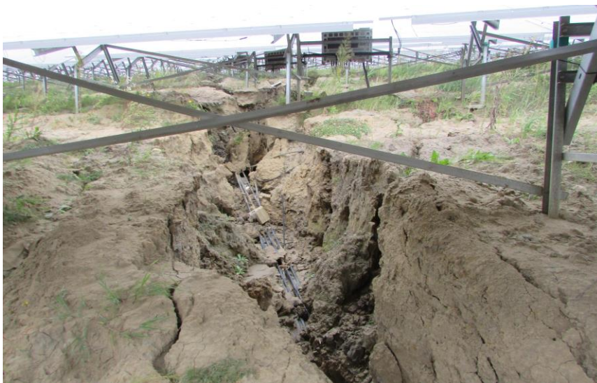
Рис. 9. Прояв глибокого яркового розмиву ґрунтового масиву, в межах якого інстальовано сонячні панелі, іноді до досить значної глибини

Ефект змін інженерно-геологічних умов полягає у тому, що за умов глибокого яркового розмиву ґрунтового масиву, в межах якого інстальовано сонячні панелі, після інтенсивних опадів можуть виникати аварійні ситуації, які призводять до радикальної зміни рельєфу під фундаментами, утворення водороїн специфічних форм та різних розмірів, що зумовлює втрату опорними несучої здатності (рис. 10).