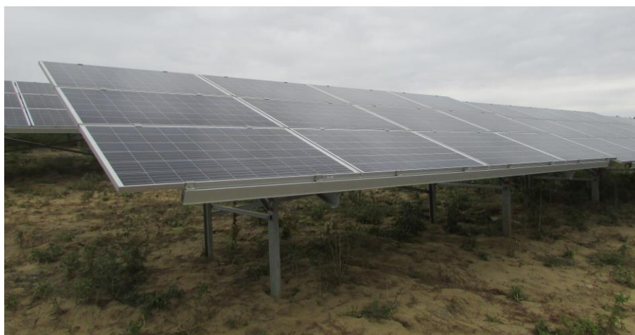
Рис. 3. Ефект «парасолі» сонячних панелей – атмосферні опади не звожують під ними ґрунт

Ефект «парасолі» полягає у тому, що ґрунтовий покрив під сонячними панелями захищений від потрапляння атмосферних опадів (рис. 3).