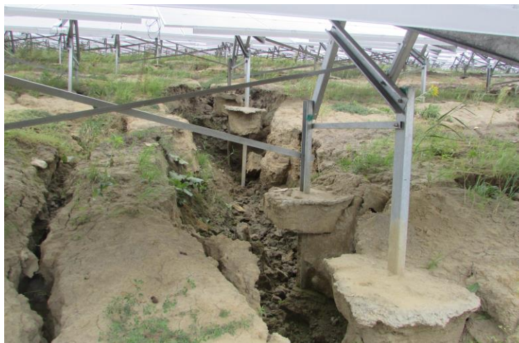
Рис. 10. Ефект змін інженерно-геологічних умов за умов глибокого яркового розмиву ґрунтового масиву, що призводить до радикальної зміни рельєфу під фундаментами, утворення водороїн специфічних форм та різних розмірів, зумовлює втрату опорними несучої здатності

Ефект змін інженерно-геологічних умов полягає у тому, що за умов глибокого яркового розмиву ґрунтового масиву, в межах якого інстальовано сонячні панелі, після інтенсивних опадів можуть виникати аварійні ситуації, які призводять до радикальної зміни рельєфу під фундаментами, утворення водороїн специфічних форм та різних розмірів, що зумовлює втрату опорними несучої здатності (рис. 10).