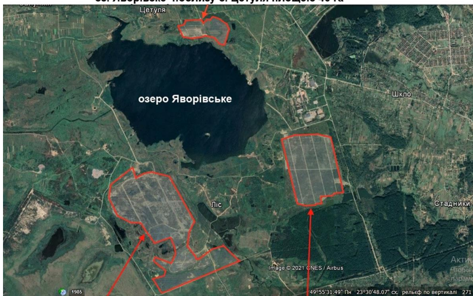
Сонячна електростанція на відвалі "Шоти" площею 175 га Сонячна електростанція на відвалі "Окілки" площею 120 га