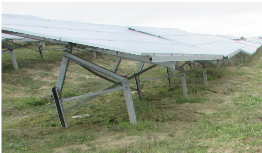
Рис. 4. Ефект затінення – порушення під сонячними панелями інсоляції ґрунтового покриву

Ефект «парасолі» дуже подібний до ефекту затінення , коли ґрунтовий покрив під сонячними панелями певний період часу захищений від інсоляції (рис. 4).