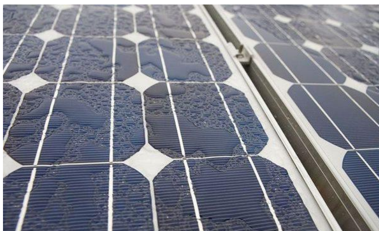
Рис. 5. Ефект концентрування зливових опадів на поверхні сонячних панелей, що полягає у накопиченні розрізненних крапель та їхньому акумулюванні у різні за розмірами та формою збільшення агрегації, які в умовах нахилу, під дією гравітації, стікають донизу

Ефект концентрування зливових опадів полягає у тому, що сонячні панелі на своїй поверхні накопичують досить значні об'єми атмосферних опадів, коли розрізнені краплі та їхні агрегації, різні за розмірами та формою, в умовах нахилу, під дією гравітації, стікають донизу (рис. 4), а за їхньої значної інтенсивності сприяють посиленому концентрованому стоку у ґрунт (рис. 5).