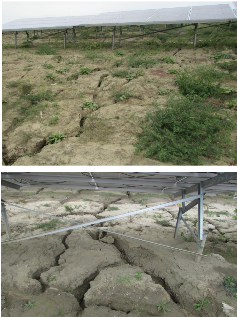
Рис. 8. Зростання інтенсивності приповерхневої лінійної ерозії від ледь заглибленої (вгорі) до досить заглибленої (внизу)

Головною умовою зародження і розвитку такого роду проявів приповерхневої лінійної ерозії є наявність контуру живлення – концентрованого зливого стоку із сонячних панелей – та можливість безперешкодного винесення за межі ерозійного врізу розмитого матеріалу. Іншими словами, гідравлічний напір водного потоку повинен бути настільки потужним та мати такі швидкості руху, за яких не лише буде винесений уламковий матеріал, а й відбуватиметься поглиблення тальвігу. Саме це забезпечує динамічний розвиток лінійної ерозії та її поглиблення за глибокого розмиву ґрунтового масиву, в межах якого інстальовано сонячні панелі, іноді до досить значної глибини (рис. 9).