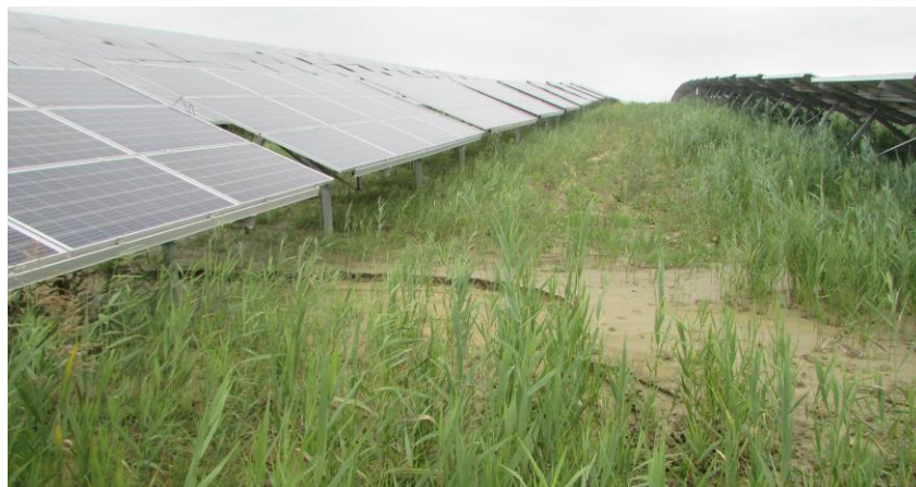
Рис. 7. Прояви точкового ерозійного розмиву концентрованими стоками зливових атмосферних опадів із сонячних панелей

Ефект активізації ерозійних процесів полягає у точковому, приповерхневому лінійному та глибокому ярковому розмиві ґрунтів зливовими опадами, що концентровано стікають із сонячних панелей (рис. 7–9).