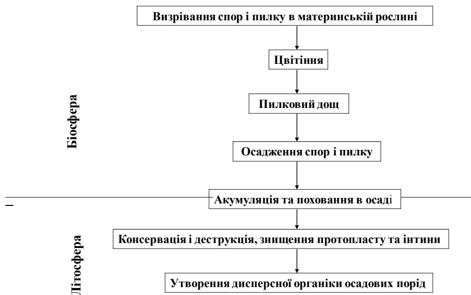
Рис. 1. Загальна схема утворення дисперсної органічної речовини осадових порід

Палінологічні дослідження, як і будь-які інші стратиграфічні дослідження, охоплюють три рівні – локальний, регіональний, глобальний та такі етапи: польовий, лабораторний, камеральний та наукової обробки (або інтерпретаційний) [4].