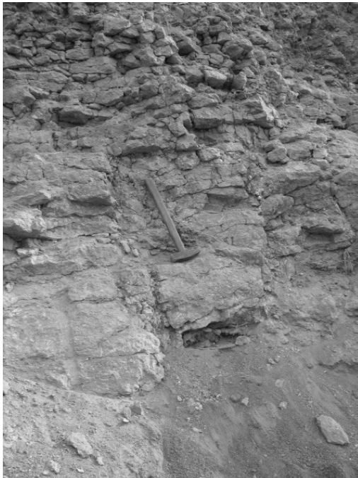
Рис. 4. Імпактити плитчастої структури (залягають на пористих тагамітах)

Унікальними геологічними об'єктами є відслонення порід ударного метаморфізму – імпактитів, які спостерігають у південній частині кратера долини р. Собик, поблизу с. Лугова Іллінецького та с. Іванька Липовецького районів (рис. 4). Вони виявлені в свердловинах південної і центральної частин структури, де їхня потужність становить – 70 м.