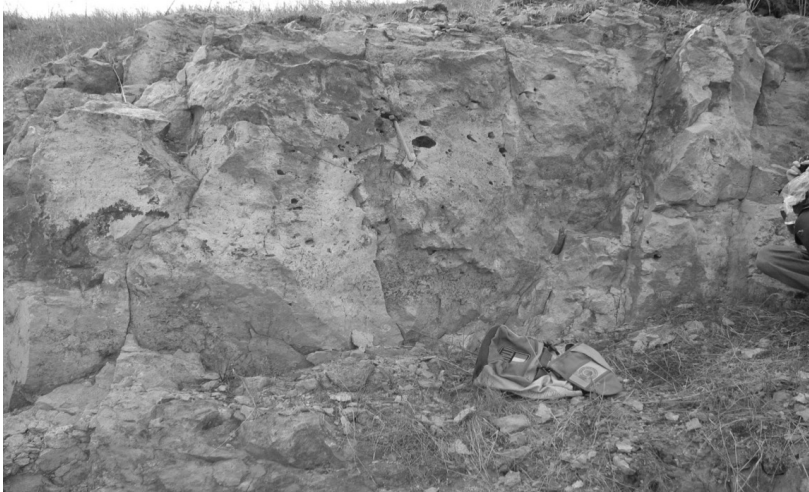
Рис. 3. Пористі тагаміти верхнього шару