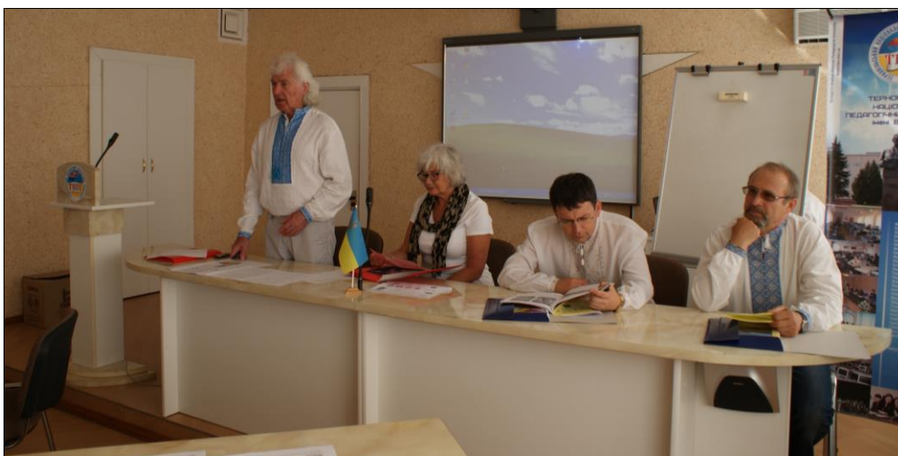
Рис. 1. Відкриття ХІХ українсько-польського семінару “Леси і палеоліт Поділля”

Черговий, ХІХ українсько-польський семінар на тему “Леси і палеоліт Поділля” відбувся 23–27 серпня 2015 р. у м. Тернопіль, поблизу якого розташовані потужні і добре стратифіковані розрізи плейстоценової лесово-грунтової серії і багат шарові палеолітичні стоянки Великий Глибочок, Пронятин, Ігровиця, Буглів, Ванжулів, Волочиск та ін. Семінар проходив у рамках українсько-польської програми “Стратиграфічна кореляція лесів і льодовикових відкладів України і Польщі” (рис. 1).