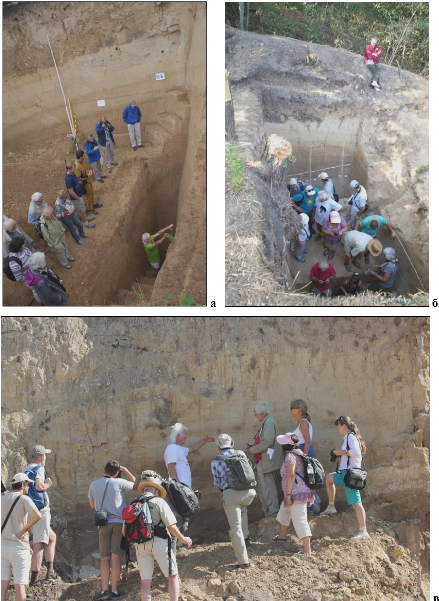
Рис. 3. Наукові дискусії під час семінару на опорних розрізах і палеолітичних стоянках: а – Великий Глибочок; б – Пронятин; в – Волочиськ

Наукові дискусії семінару проходили на опорному розрізі плейстоценових відкладів Волочиськ та палеолітичних стоянках Пронятин, Великий Глибочок, Ігровиця, а також під час його пленарних і секційних засідань (рис. 3).