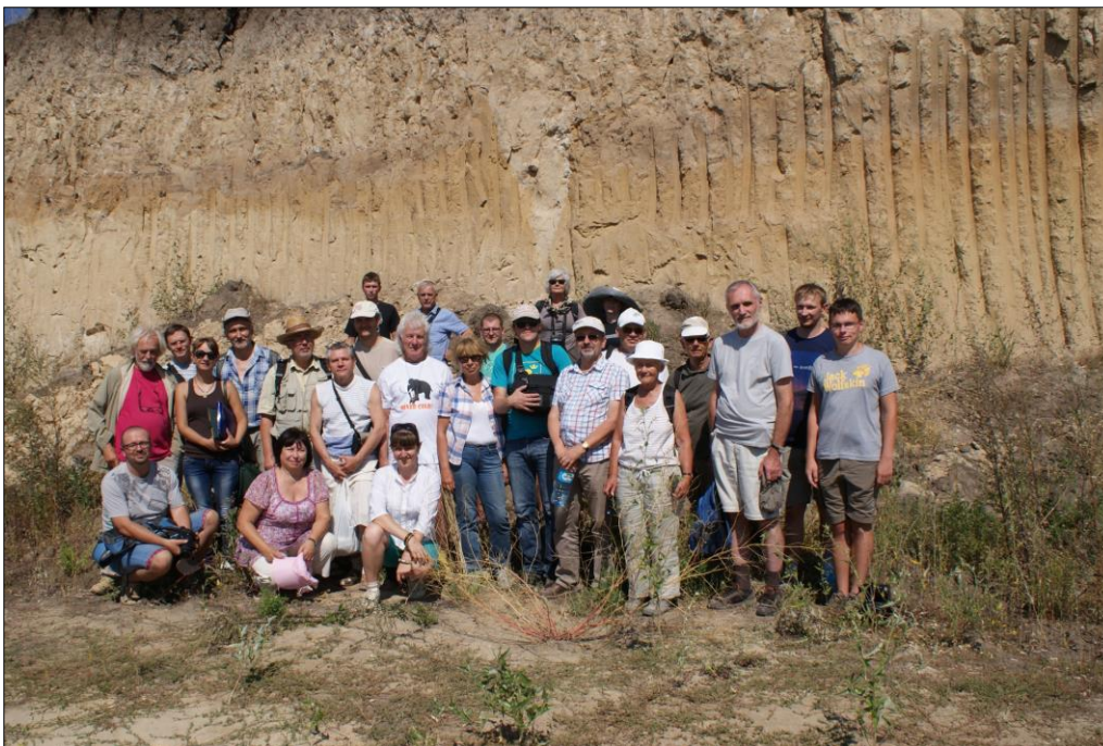
Рис. 2. Учасники семінару на опорному розрізі Волочиськ (Хмельниччина)

ситет, Державний геологічний інститут – Державний дослідницький інститут (м. Варшава, РП), Гданський університет, Вроцлавський університет, Західнопоморський технологічний університет у Щецині (РП), Інститут геологічних наук ПАН (м. Варшава, РП), Жешівський університет, Королівський інститут природничих наук Бельгії (м. Брюсель), Білоруський державний педагогічний університет імені Максима Танка (рис. 2).