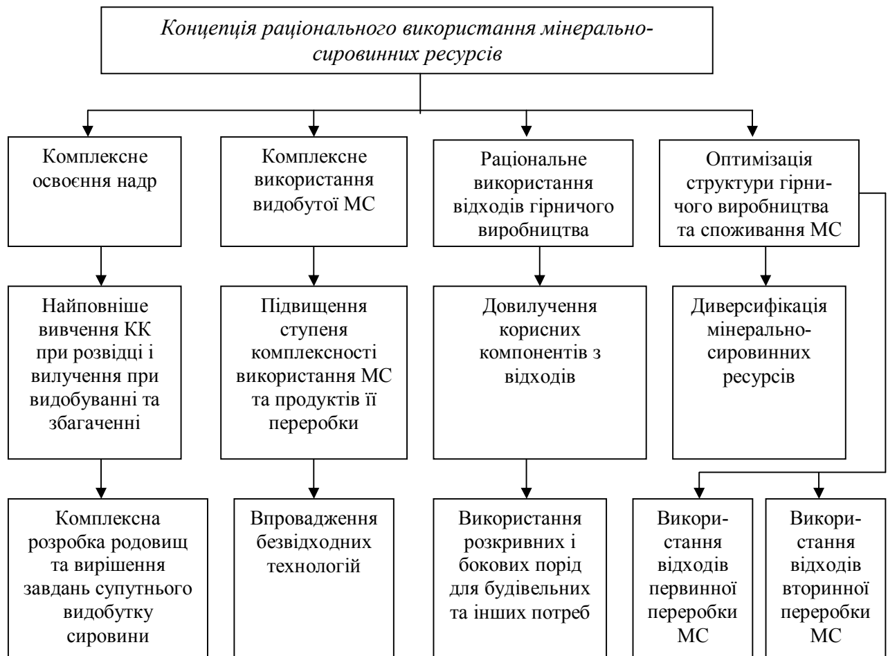
Рис. 2. Структура заходів, спрямованих на вирішення проблеми раціонального використання мінерально-сировинних ресурсів регіону

Нераціональне видобування і використання МСР спричинює до зростання витрат на усіх стадіях гірничого виробництва. Втрати корисних копалин за їхнього добування і первинної переробки в окремих випадках сягають 40–50%.