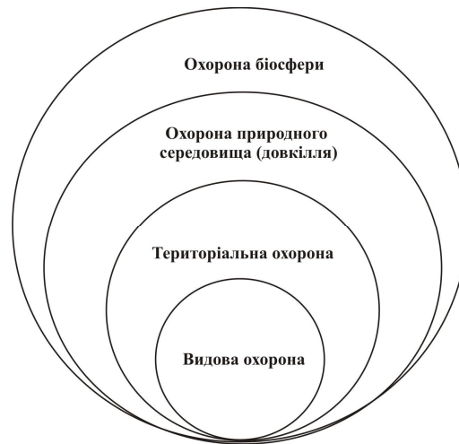
Рис. 2. Етапи розвитку природоохоронної концепції

Сучасний атомно-космічний період розвитку цивілізації, коли техногенний вплив став проявлятися у глобальному вимірі і виникла небезпека незворотних процесів у природі, формується якісно нова парадигма охорони біосфери як планетної екосистеми. Етапи еволюції природоохоронного мислення, яке вплинуло й на формування природоохоронної науки, проілюстровано на рис. 2.