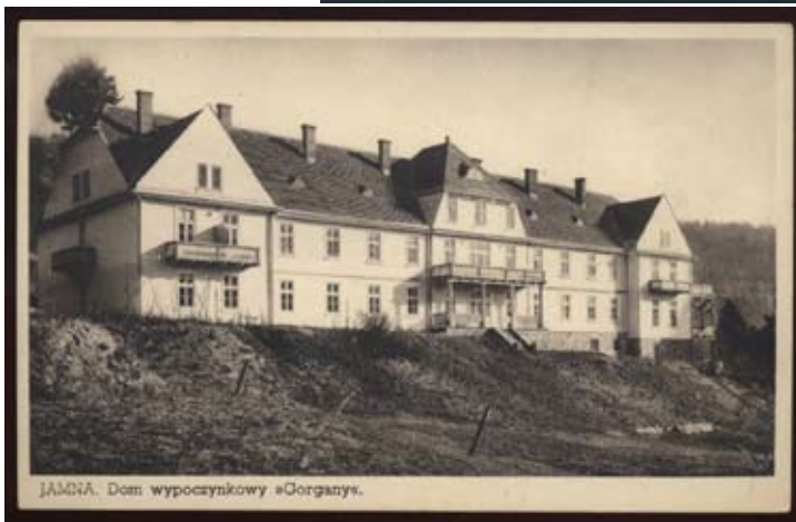
Рис. 3. Найпотужніші санаторні комплекси Яремчанської ТРС першої половини XX ст.