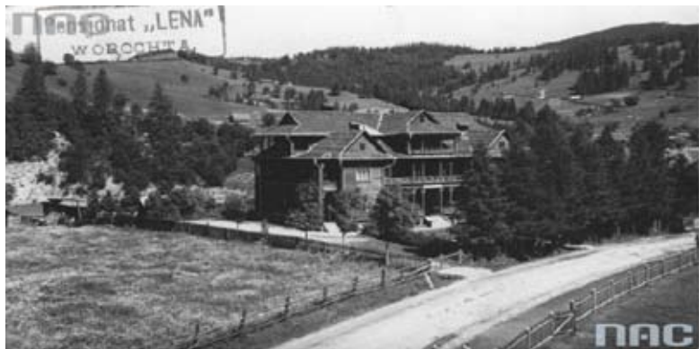
Рис. 2. Перлини самобутнього (“карпатського”, “гуцульського”, “закопанського”) архітектурного стилю рекреаційної забудови Яремчанської ТРС першої половини ХХ ст.