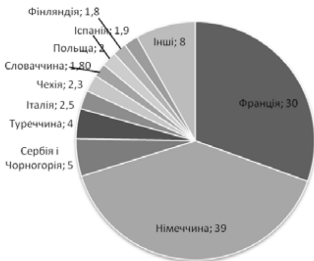
Рис. 1. Структура виїзних потоків українських волонтерів за 2004-2009 рр. [8]