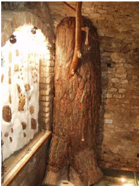
Рис. 2. Сосна Pinus succinifera у експозиції музею Art Center of Baltic Amber у м. Вільнюс [26]