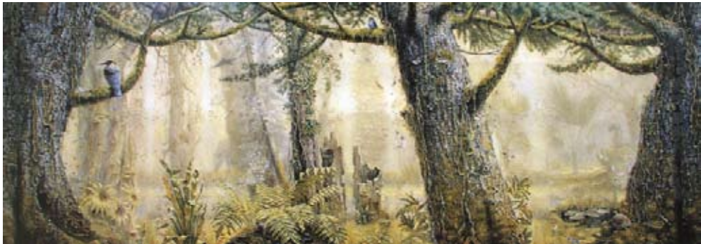
Рис. 1. Бурштиновий ліс (Музей Бурштини в Данії) [26]