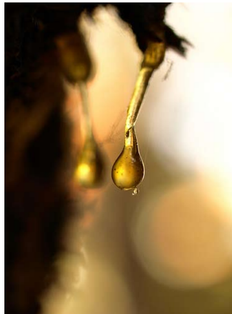
Рис. 3. Смола сосни Pinus succinifera – через мільйони років стане бурштином-сукцинітом [26]