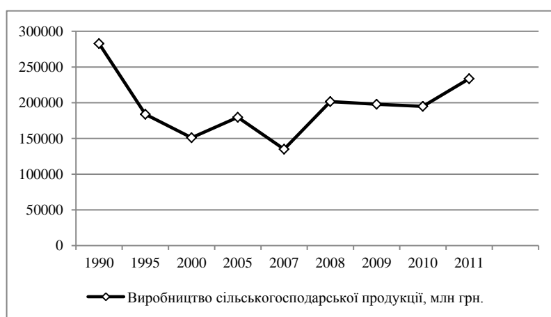
Рис. 2. Динаміка валової продукції сільського господарства, млн грн (у порівняльних цінах 2005 р.)