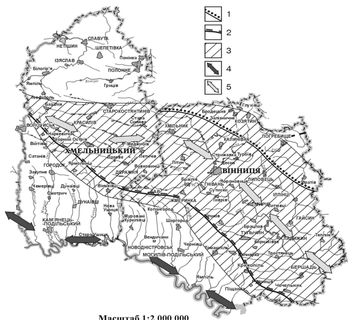
Рис. 1. Субмеридіональна мережа дорожніх ландшафтів Східного Поділля (V ст. до н.е. – XIII ст.) [4]:

1 – Кучманський шлях; 2 – Чорний шлях; 3 – зона впливу Чорного й Кучманського шляхів на ландшафти, торгіві, “водні” й “прирічкові” шляхи; 4 – Придністер’я; 5 – Побужжя