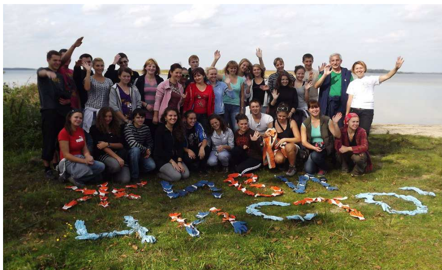
Викладачі і студенти кафедри на природоохоронній акції