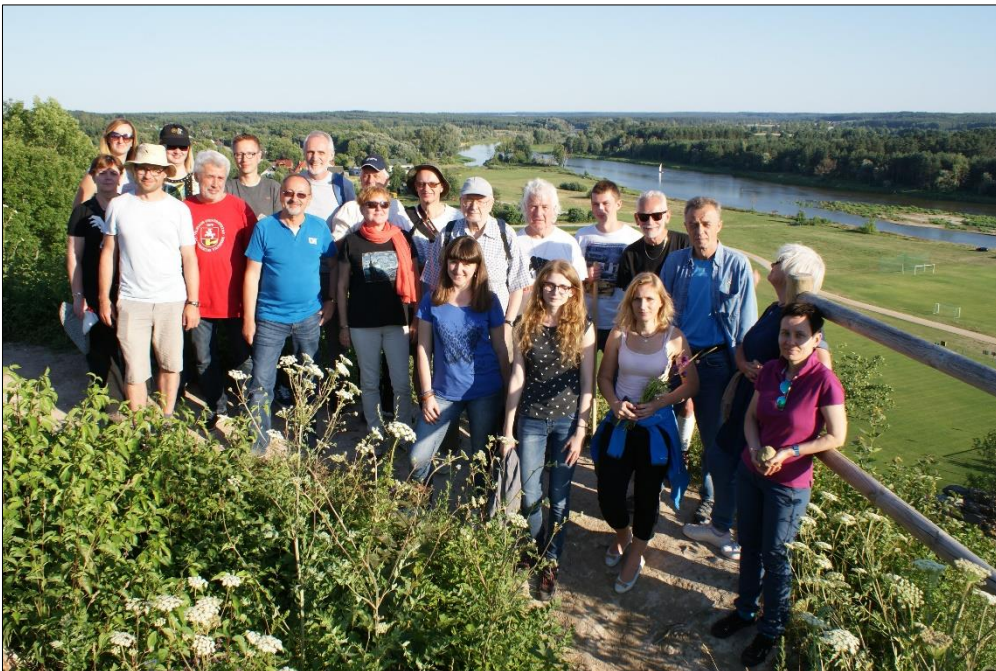
Рис. 4. Фото на пам'ять над Бугом у Мельнику Fig. 4. Photo in memory above the Bug in Mielnik