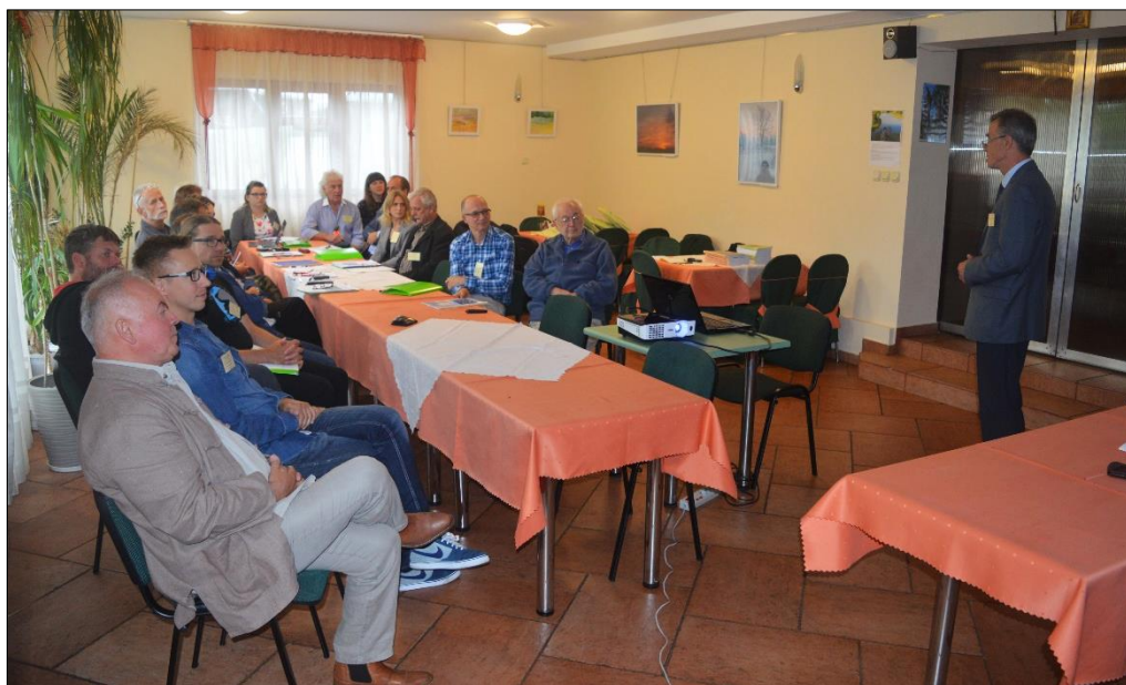
Рис. 2. Пленарне засідання семінару Fig. 2. Plenary session during the seminar