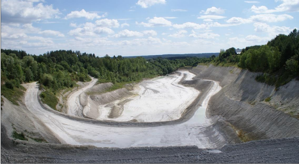
Рис. 3. Крейдовий кар'єр у Мельнику Fig. 3. Chalk quarry at Mielnik