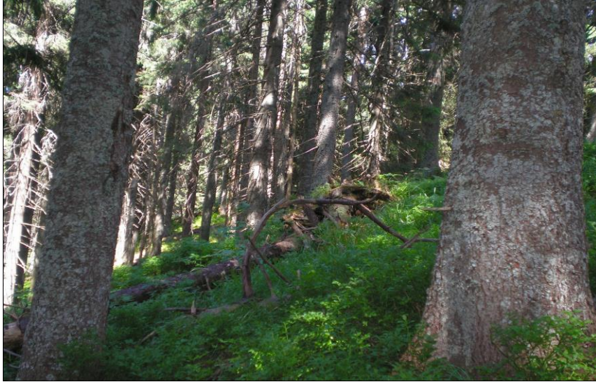
Рис. 3 Чистий смерековий праліс у Чорногорі [4] Fig. 3. Pure spruce virgin forest of the Chornohora [4]