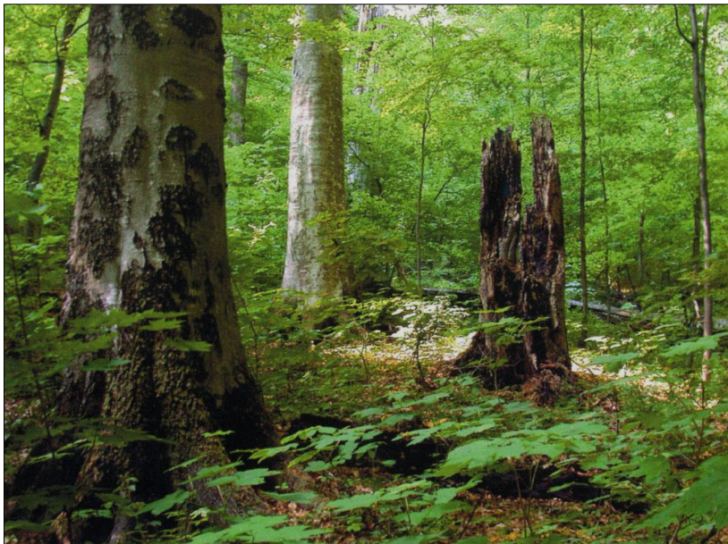
Рис. 2. Угольські букові праліси [3] Fig. 2. Uholka virgin beech forests [3]