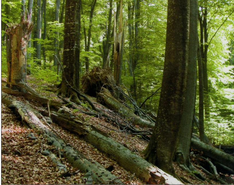
Рис.1. Багатий на мертву деревину буковий праліс (Угольський масив) [3] Fig. 1. Rich in dead wood virgin beech forest (Uholka Massif) [3]