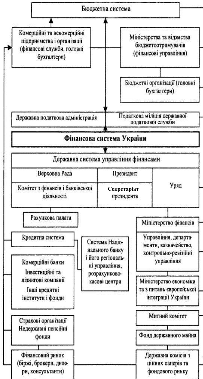
Рис 1. Інфраструктура фінансової системи України