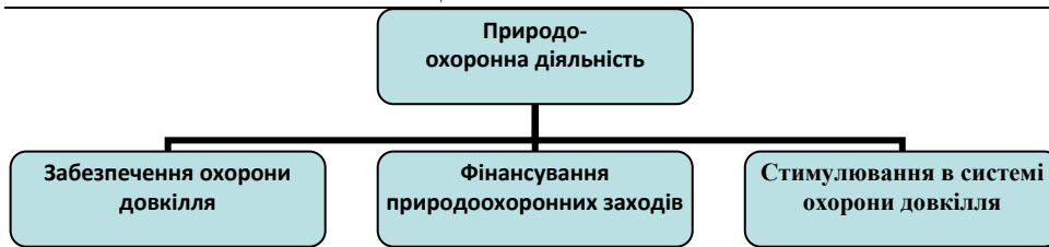
Б. Блок природоохоронної діяльності.