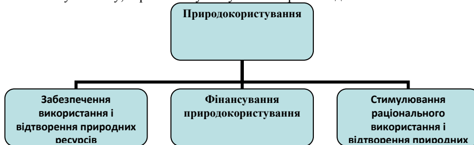
А. Блок природокористування.

З точки зору координації природокористування і природоохоронної діяльності на національному рівні - з міжнародними стандартами ми сформулювали трьохблочний функціонально-економічний алгоритм (див. рис. 3). Головним у цій схемі є принцип добровільного запровадження підприємствами-природокористувачами міжнародних стандартів (стандартів якості виробництва, стандартів якості продукції (товарів, виробів, послуг), стандартів якості довкілля і стандартів якості життєдіяльності людини). Такий принциповий підхід, заснований на поєднанні державного регулювання і підприємницької ініціативи може забезпечити належні показники якості виробництва, споживання, відтворення, а отже відповідну міжнародним еколого-економічним стандартам економічну систему, зорієнтовану на сучасні потреби людини.