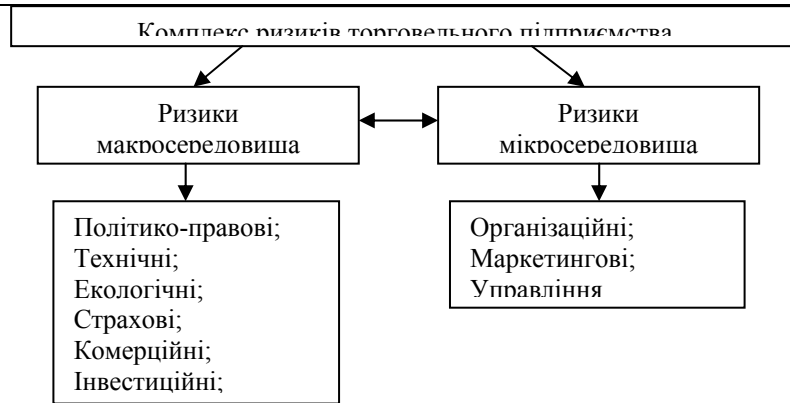
Рис. 1. Складові елементи комплексу ризиків торговельного підприємства