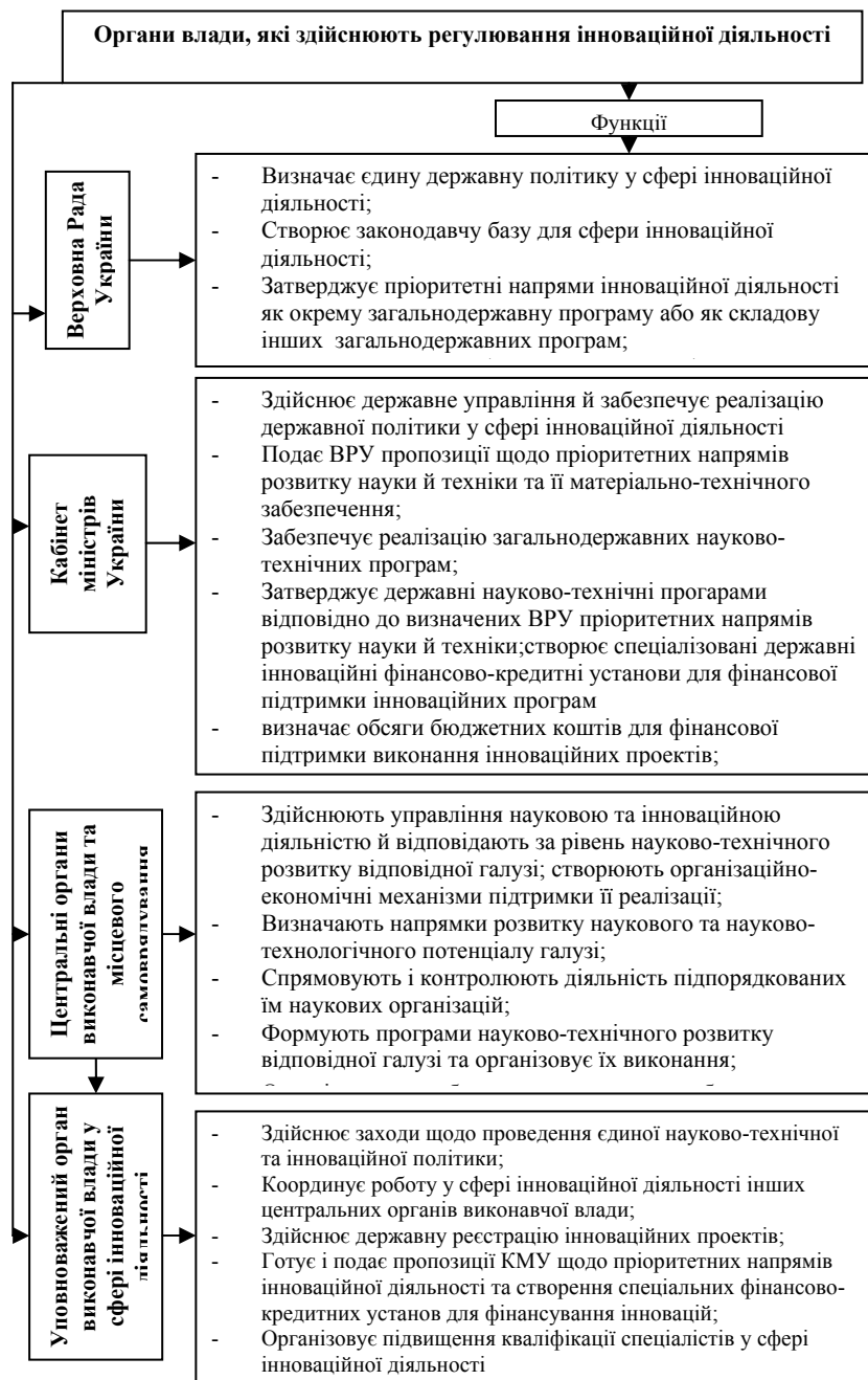
Рис. 2. Функції основних державних органів влади у сфері регулювання інноваційної діяльності ( розроблено на основі досліджень автора)