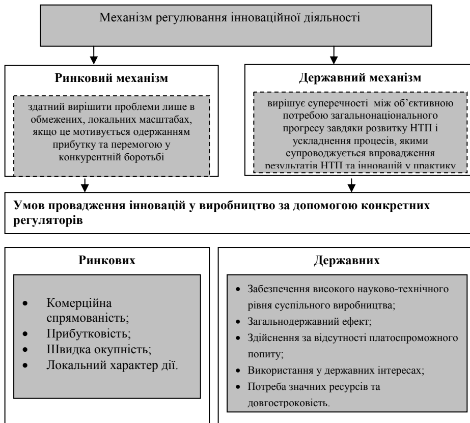
Рис.1. Особливості регулювання інноваційної діяльності на основі ринкового і державного механізмів [11, с. 143]

Однак, слід відзначити, що сьогодні колосальний науковий багаж досліджень і життєвий досвід свідчить про те, що за допомогою умілого і гнучкого державного регулювання всі великі країни світу і більшість тих, що розвиваються, визначають напрями розвитку економіки на всіх рівнях: від країни в цілому до первинної ланки – підприємства, об'єднання і, зрозуміло, до форм і методів підприємницької діяльності [11, с. 33].