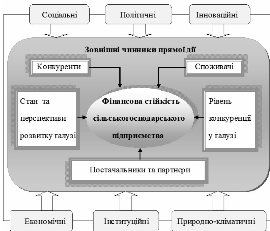
Рис. 2. Зовнішні чинники прямої і непрямой дії, що впливають на фінансову стійкість сільськогосподарського підприємства

Зовнішні чинники непрямого впливу, що впливають на фінансову стійкість сільськогосподарських суб'єктів господарювання, доречно поділити на такі групи: