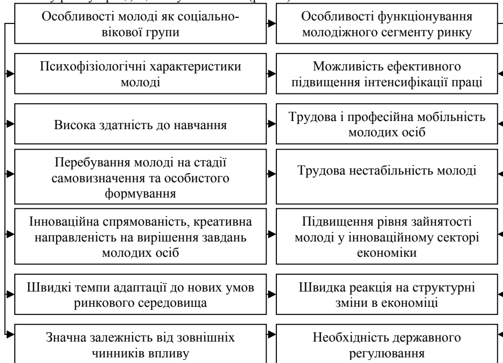
Рис. 1. Особливості молодіжного сегменту ринку праці в контексті розгляду даної соціально-вікової групи

молодіжного сегменту ринку праці, проте відсутній єдиний підхід визначення особливостей функціонування даного сегменту. На нашу думку, для детального аналізу вивчення проблем молодіжного сегменту ринку праці необхідно не лише визначити особливості даної соціально-вікової групи, але й встановити причинно-наслідкові зв'язки між ними та характеристиками функціонування молодіжного сегменту ринку праці, що їх зумовлюють (рис. 1).