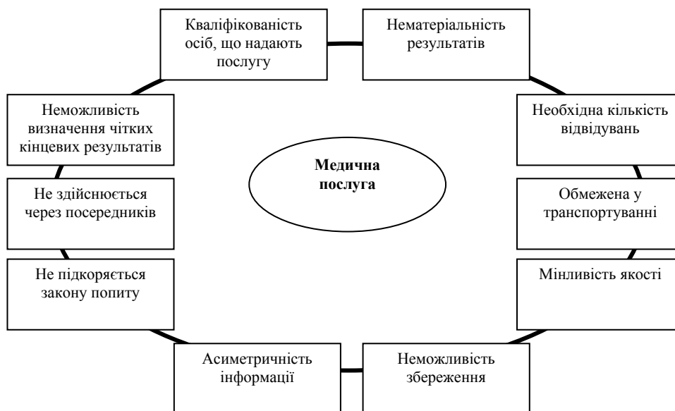
Рис. 1.2. Взаємозв'язок структурних елементів поняття медична послуга

медичних послуг має безліч особливостей, що залежать від «товару», який на ньому реалізується. Враховуючи виділені особливості поняття медичної послуги ринок медичних послуг є специфічним.