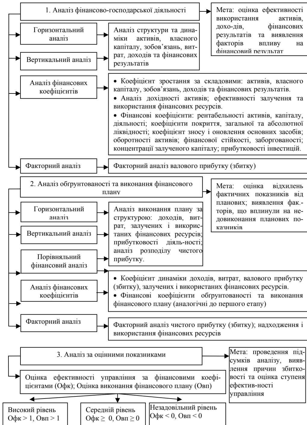
Рис. 2. Схема аналізу ефективності діяльності підприємств ДСЕ