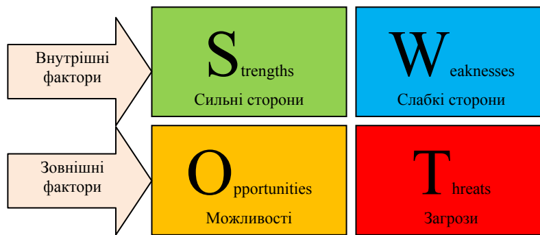
Рис. 1. Фундаментальні елементи SWOT-аналізу місцевого розвитку

SWOT-аналіз є необхідним елементом дослідження, обов'язковим попереднім етапом при складанні будь-якого рівня стратегічних планів. Дані, одержані в результаті ситуаційного аналізу є базовими елементами при розробці стратегічних цілей і задач міського розвитку.