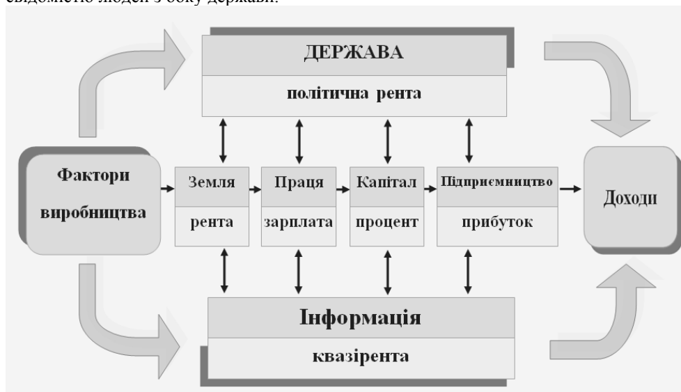
Рис. 1 Сучасна система факторів виробництва та доходів

підвищення їх значимості та статусності в суспільстві, що ускладнило управління свідомістю людей з боку держави.