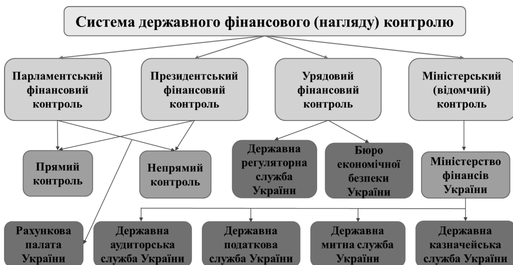
Рис. 2. Система органів державного фінансового контролю в Україні

Щоб здійснити належний аналіз результатів державного фінансового контролю в Україні, необхідно з’ясувати як організована система державного фінансового контролю в країні (рис. 2).