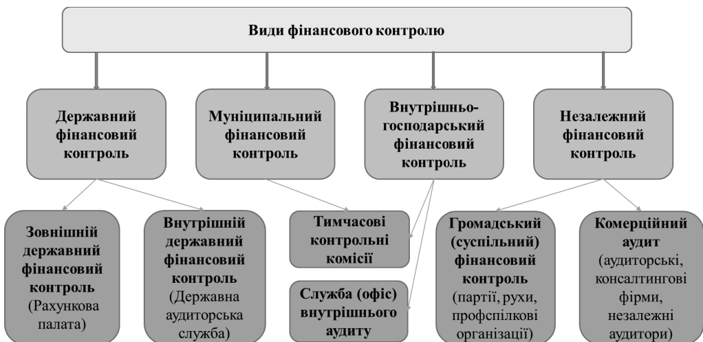
Рис. 1. Види фінансового контролю як комплекс професійних контрольно-перевірочних заходів за суб'єктами здійснення

Державний фінансовий контроль займає ключову позицію серед інших видів фінансового контролю (рис. 1) і відіграє важливу роль у захисті інтересів держави та суспільства у сфері надходження та використання державних коштів. Належна організація такого контролю впливає на напрямки економічного розвитку країни, добробут населення, а також масштаби тіньової економіки та економічної злочинності.