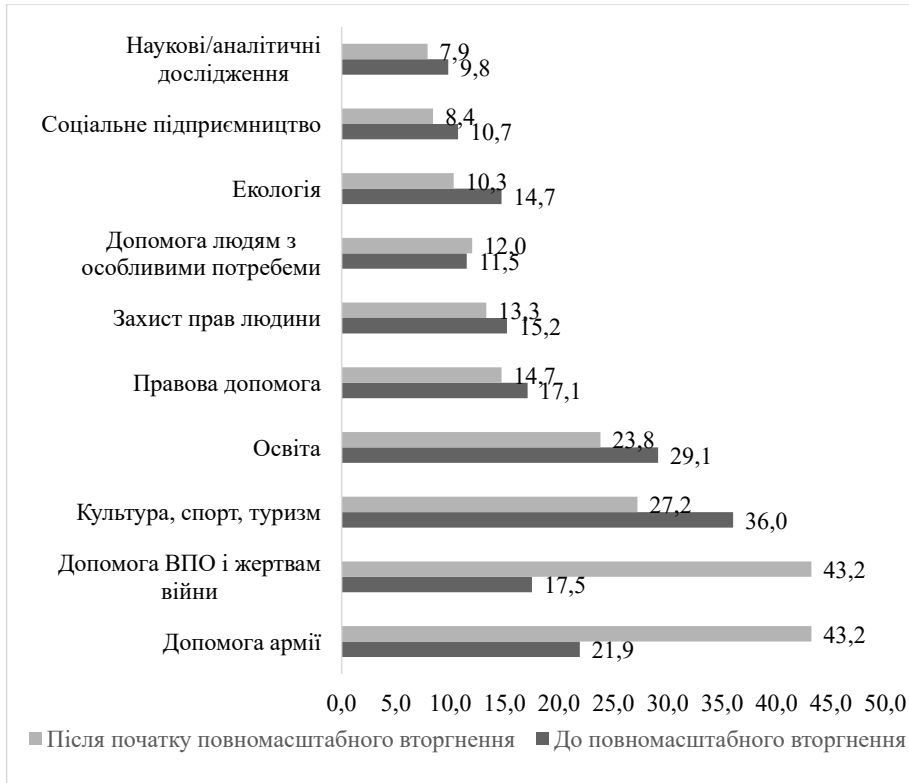
Рис. 2. Порівняння найпоширеніші сфер діяльності громадських організацій та благодійних організацій до та після повномасштабного вторгнення [5]

В Україні існує низка внутрішніх і зовнішніх викликів, що ускладнюють формування дієвої державної політики з метою розвитку громадянського суспільства та підтримки громадських організацій. Дотепер залишаються неузгодженими підходи до ролі та місця громадських об'єднань у контексті визначення сутності й результативності реалізації державної політики в різних суспільних сферах. Відповідно спостерігається неузгодженість дій різних гравців на етапах не лише формування, але й впровадження державної політики.