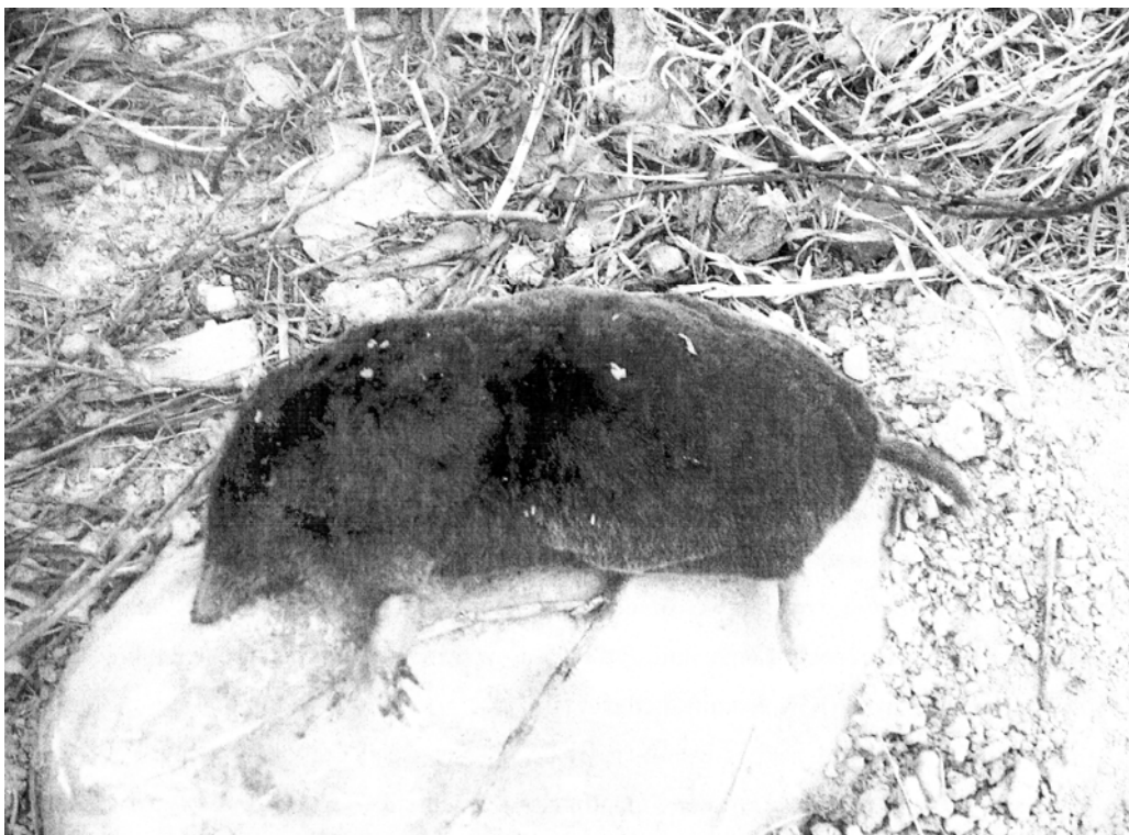
Рис. 3. Кріт європейський ( Talpa europaea L.).

У таких місцях ґрунт розсипається на пил, який у більшості випадків розвіюється вітром і таким чином поширюється та горизонтально мігрує у просторі в родючійший ґрунтовий горизонт [3–6, 18, 19]. Однак, якщо порівнювати види активності підземних і наземних тварин, то вони суттєво відрізняються, оскільки наземні тварини у пошуках їжі та місць укриття переміщуються протягом доби з однієї екосистеми в іншу або в