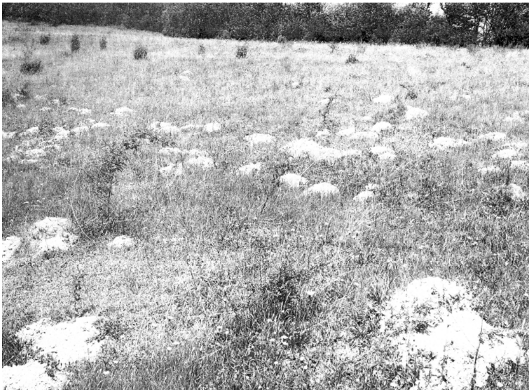
Рис. 2. Викиди крота європейського ( Talpa europaea L.) на пасовищах.