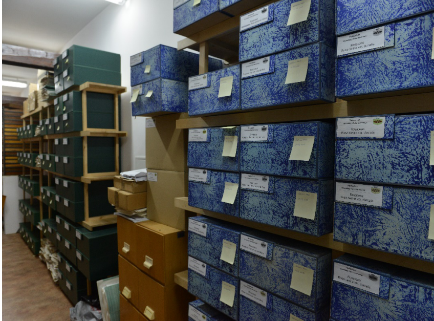
Fig. 1. The method of storing herbarium specimens in the herbarium of the Ojców National Park

plants (cryptogamic plants, vascular plants, genera Crataegus , Rosa , and Rubus ), which were documented in the ONP herbarium, the total number of sheets in the herbarium, or the number of sheets of representatives of various taxonomic groups, collected in various regions of Poland and other countries.