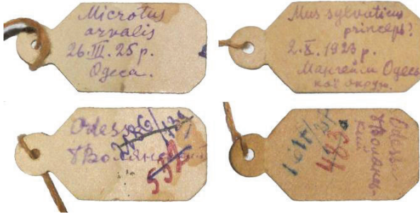
Рис. 8. Авторські етикетки на двох зразках (знизу – зворотний бік) гризунів у колекції ННПМ: ліворуч – полівки звичайної, Microtus arvalis , з окол. Одеси, 1925 р.; праворуч – мишака лісового, Sylvaemus sylvaticus , з «Мангейму» (нині – Кам'янка), 1923 р.

виповнилося 63 роки, натомість Богданові було 19). Там само є збори, позначені як збори О. Браунера 1920 р. з Одеського р-ну ( Sylvaemus sylvaticus ), хоча мова могла би йти про колекцію Браунера, а не про колектора Браунера.