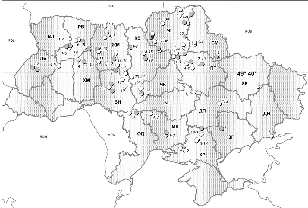
Рис. 1. Розташування підземель, обстежених авторами у межах цієї роботи: темні позначки – підземелля, в яких виявлено рукокрилих. Номери на карті відповідають номерам у списку підземель і переліку реєстрацій, наведених нижче.