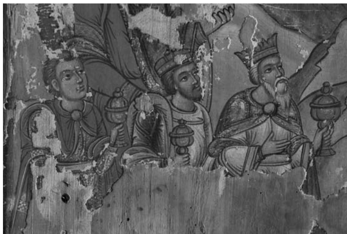
Три царі з дарами. Фрагмент ікони Собор Пресвятої Богородиці, 1560–1580-ті роки