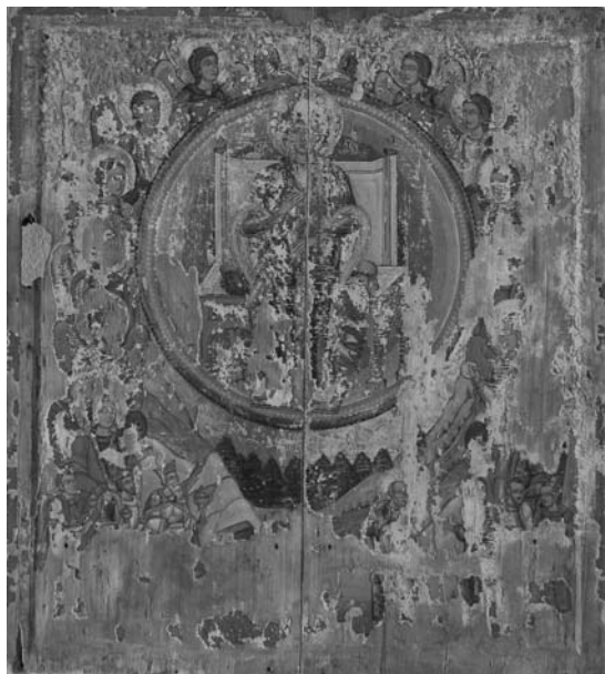
Собор Пресвятої Богородиці, 1560–1580-ті роки с. Лопушанка