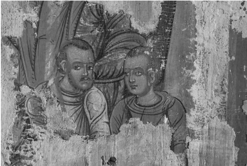
Пастухи. Фрагмент ікони Собор Пресвятої Богородиці, 1560–1580-ті роки