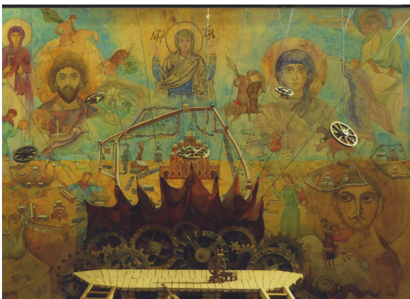
Світлина 2. Т. Медвідь. Макет до вистави “Боярина” Лесі Українки. Харківський академічний драматичний театр ім. Т. Шевченка “Березіль” 1991 р. Режисер В. Оглоблін