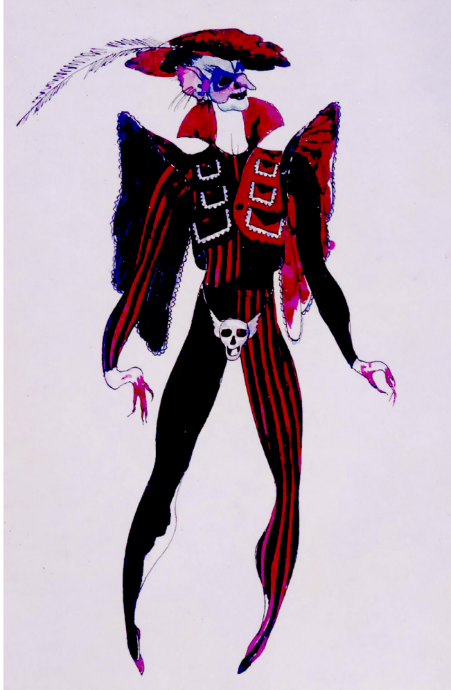
Світлина 5. Т. Медвідь. Ескіз костюму до вистави “Сни Крістіана” за п’єсою Г. Х. Андерсена “Олле Лукойе”. Харківський академічний драматичний театр ім. Т. Шевченка “Березіль” 1995 р. Режисер О. Кравчук (Архів музею театру “Березіль”)